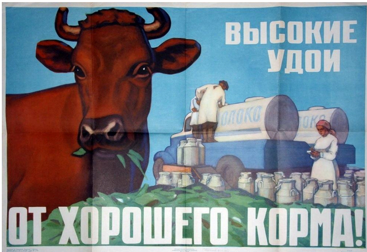
Советский плакат с надписью «Высокие удои от хорошего корма!»

При этом проверки Комитета госконтроля показывают, что массовая гибель животных – это системная проблема, вызванная плохими условиями содержания, недостаточным питанием и нехваткой лечения. В Генпрокуратуре еще в 2022 году заявляли , что «практически в 100% случаев падеж скота происходит из-за нарушения норм кормления и содержания».