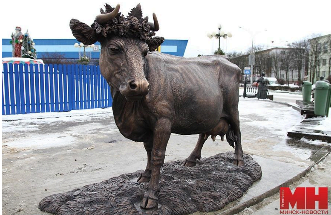
Скульптура коровы-кормилицы на площади у Комаровского рынка в Минске,

Колхозы производят почти 98% молока, по данным за 2024 год. Однако за красивыми цифрами кроется не слишком привлекательная реальность.