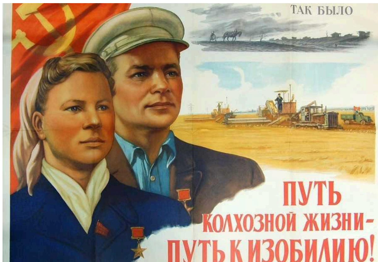
Советский плакат с надписью “Путь к колхозной жизни – путь к изобилию!”

символом белорусской деревни, вернемся в 1920-е годы, когда Советский Союз искал способ ускорить индустриализацию.