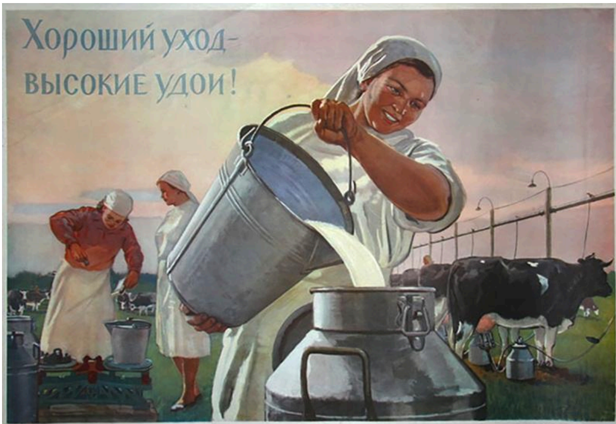
Советский плакат с надписью “Хороший уход – высокие удои!” Белопольский Б. Н., 1955

Госорганы признают , что из-за плохой еды и условий в колхозах животные умирают*, при этом штрафы получают ветеринары и менеджеры разного уровня, а дела о падеже скота составляют треть от всех уголовных дел в сельском хозяйстве в Беларуси.