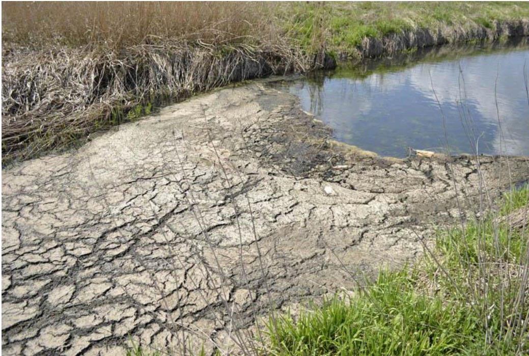
Затор на реке Наче, Крупский район

Часто ли это бывает? Десятки или даже сотни случаев нарушения обращения с навозом в водоохраных зонах выявила только одна проверка по Витебской области в 2021 году. Также, как сообщает общественный мониторинг качества воды Watercontrol.by , собиравший данные в 2016-2019 годах, навозные стоки были причиной загрязнения в половине случаев (80 из 160 случаев ).