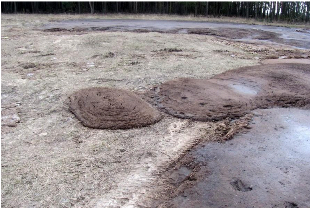
В Петриковском районе в 2017 году сельхозпредприятие слило 147 тонн

Часто ли это бывает? Десятки или даже сотни случаев нарушения обращения с навозом в водоохраных зонах выявила только одна проверка по Витебской области в 2021 году. Также, как сообщает общественный мониторинг качества воды Watercontrol.by , собиравший данные в 2016-2019 годах, навозные стоки были причиной загрязнения в половине случаев (80 из 160 случаев ).